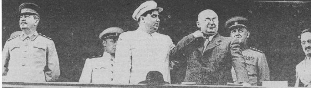
Сталин, Маленков, Берия, Булганин, Микоян.